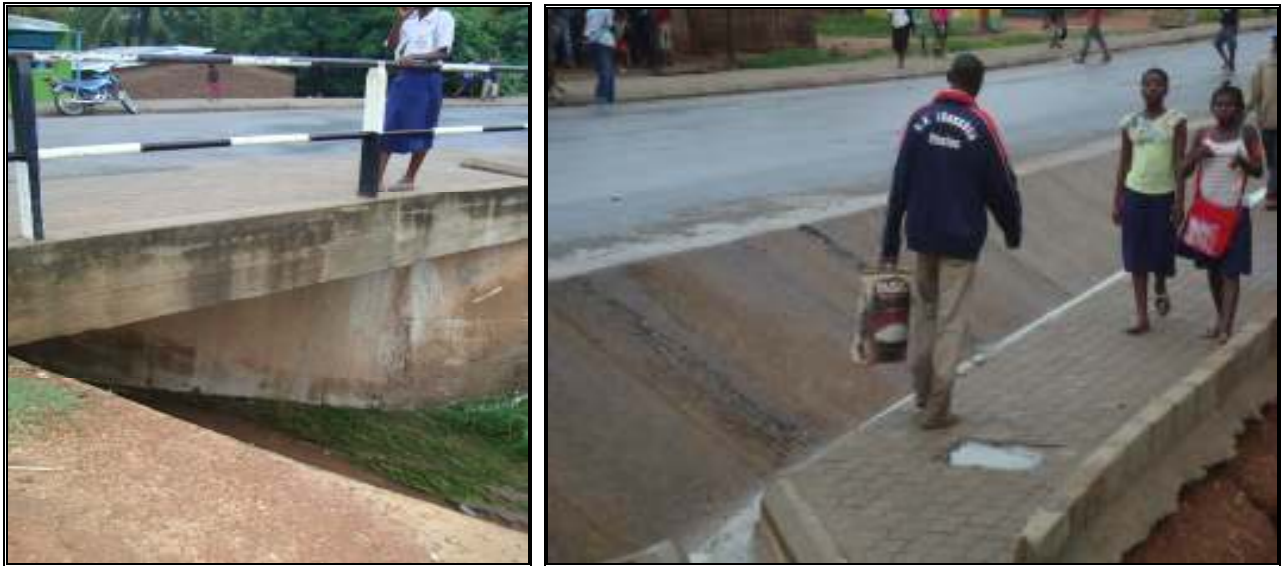
Figura 5: Via nova do Matadouro

limpeza e com algumas pontecas ao longo da via com um comprimento que varia de 4.0 a 4.8 metros.