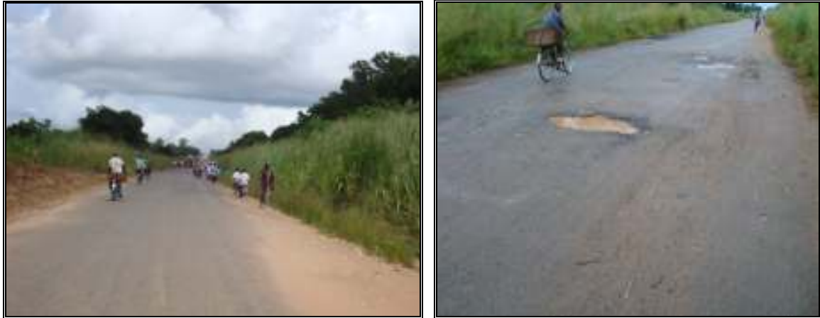
Figura 4: Troço da estrada numa zona próximo da Fábrica

trazidas pelas águas, (só existem dois buracos de grande abertura aproximadamente 2 a 3 metros de diâmetro). Aqui a largura da estrada é de 7 metros.