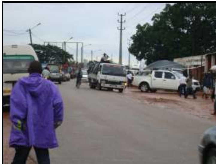
Figura 3: O tráfego na zona da Faina