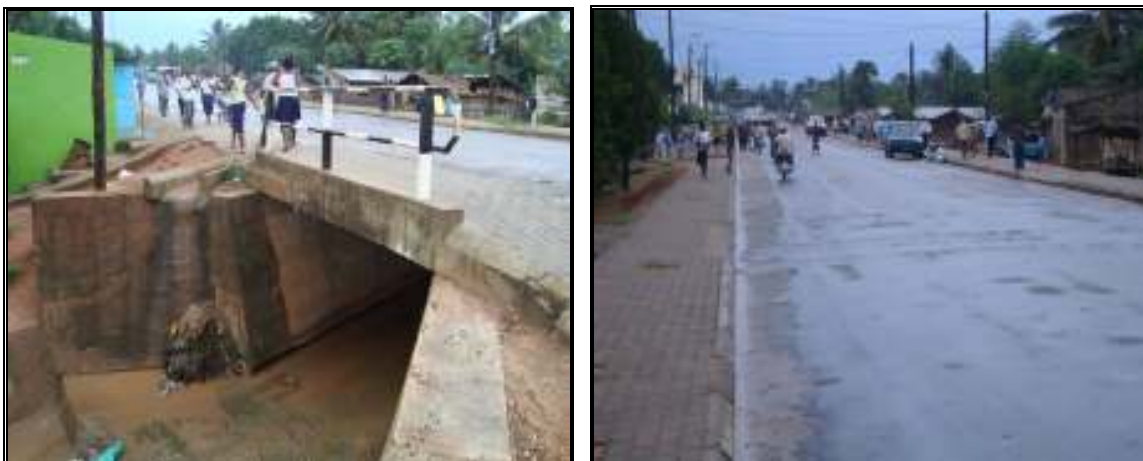
Figura 6: A via nova do Matadouro