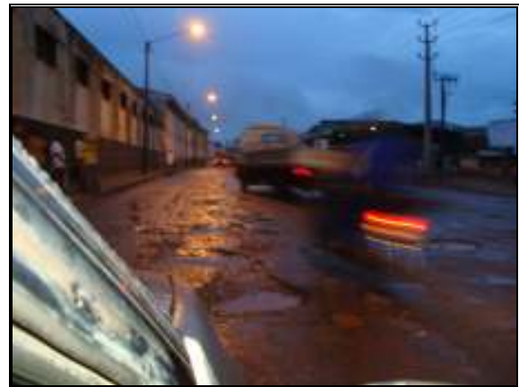
Figura 2: O estado da via na cidade de Nampula, na zona Cibal